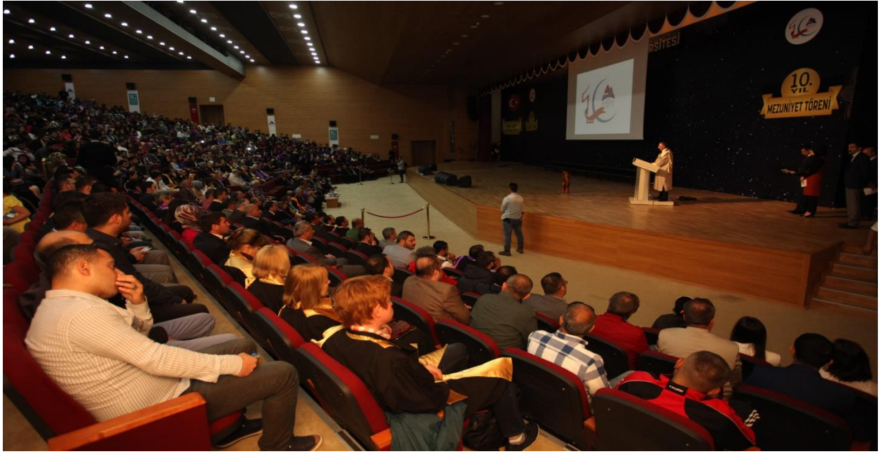
Tablo 29. Yemekhane, Kantin ve Misafirhanelerin Yerleşkelere Dağılımı